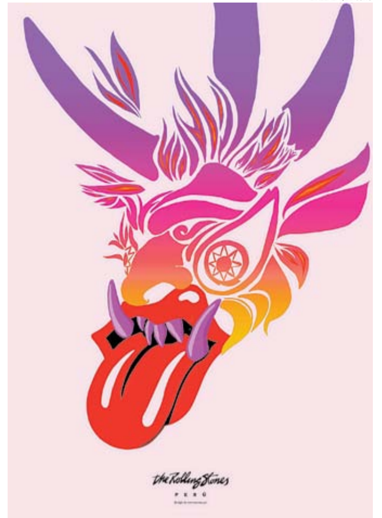
"DIABLADA", DE ICONO