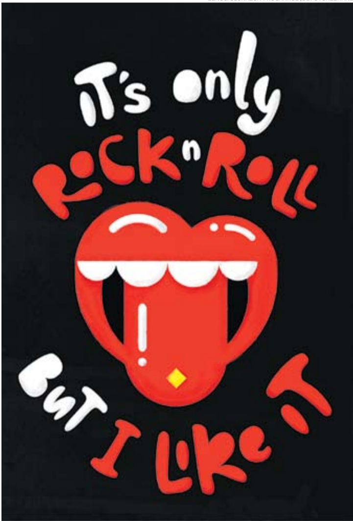
"LENGUA, CORAZÓN Y ROCANROL", DE FUTURE BRAND