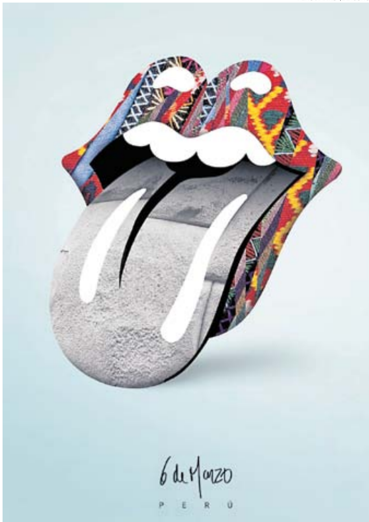
"PERUVIANRS", DE ICONO